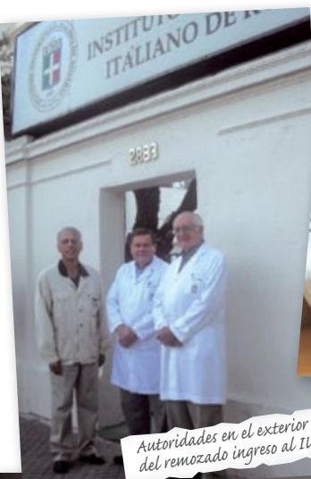
Autoridades en el exterior del remozado ingreso al IUNIR