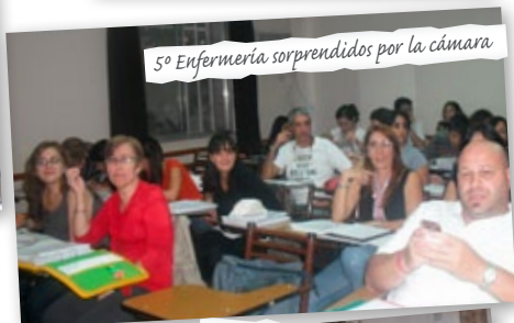
5º Enfermería sorprendidos por la cámara