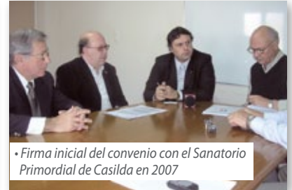
• Firma inicial del convenio con el Sanatorio Primordial de Casilda en 2007