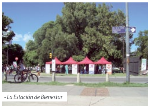
• La Estación de Bienestar

deporte amateur, así como también para concientizar a la población acerca de síntomas que pueden afectar su calidad de vida. ¡Sé parte vos también de esta iniciativa!