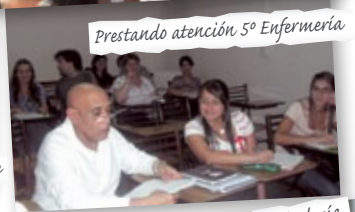
Prestando atención 5º Enfermería