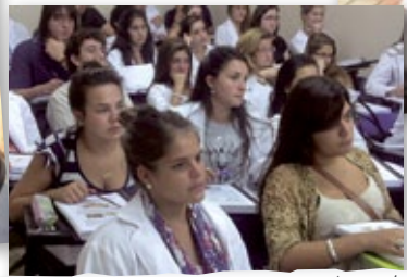
Los chicos de 1º año Medicina, concentrados en clase