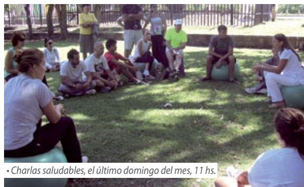
• Charlas saludables, el último domingo del mes, 11 hs.