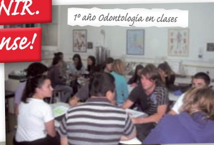
1º año Odontología en clases