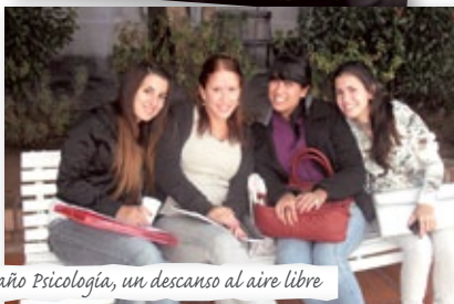
2º año Psicología, un descanso al aire libre