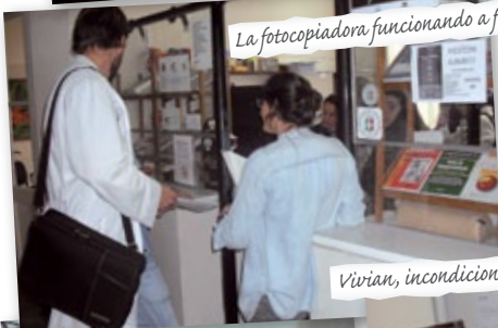
La fotocopidora funcionando a full