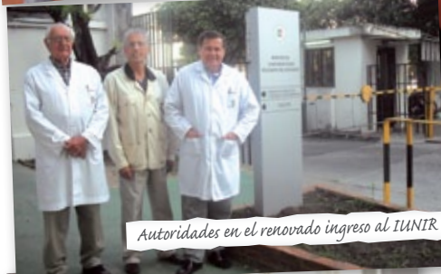
Autoridades en el renovado ingreso al IUNIR