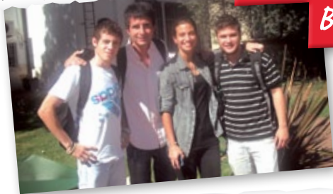
2º año Odontología en nuestra Plazoleta Giovanni Cárcano