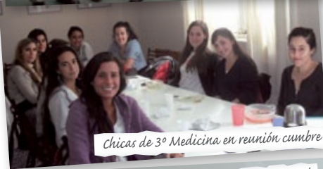
Chicas de 3º Medicina en reunión cumbre