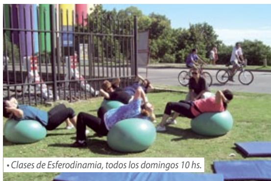
• Clases de Esferodinamia, todos los domingos 10 hs.