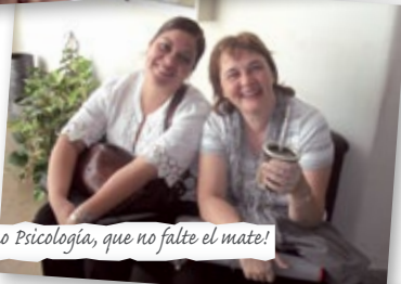
2º año Psicología, que no falte el mate!