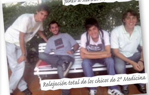
Relajación total de los chicos de 2º Medicina