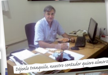
Déjenlo tranquilo, nuestro contador quiere almorzar