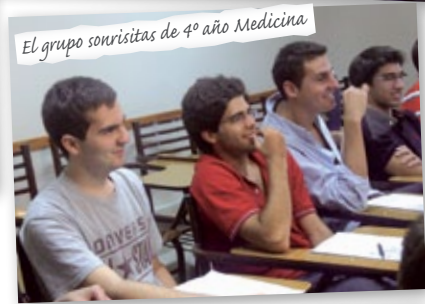
El grupo sonrisitas de 4º año Medicina