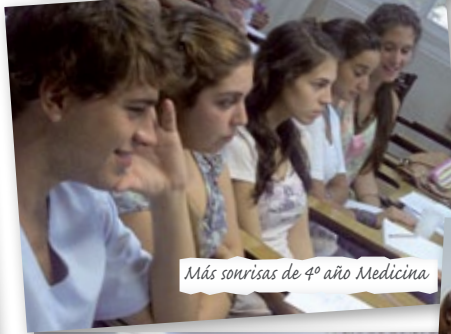
Más sonrisas de 4º año Medicina