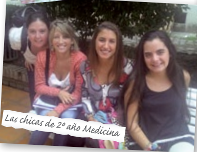
Las chicas de 2º año Medicina