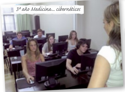
3º año Medicina... cibernéticos