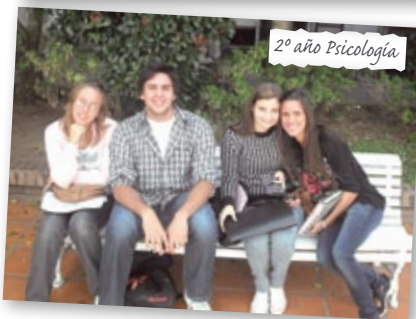
2º año Psicología