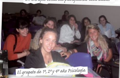
El grupete de 1º, 2º y 4º año Psicología