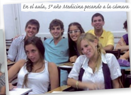
En el aula, 5º año Medicina posando a la cámara