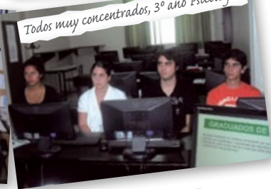
Todos muy concentrados, 3º año Psicología