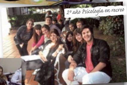
2º año Psicología en recreo