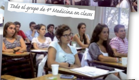
Todo el grupo de 4º Medicina en clases