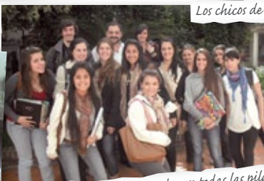
1º año Psicología comenzando con todas las pilas!